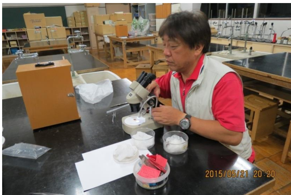
4 : 図 幼虫の腹部をメスで切開したところ、数十個の卵が詰まった卵巣が破れて噴出しました。