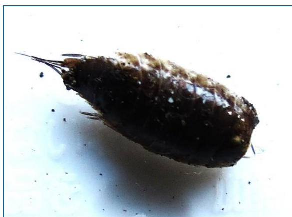
⑧ ニホンヒメフナムシ